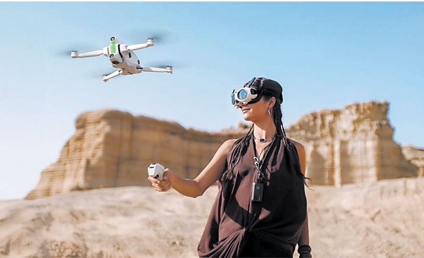
影翎全景无人机