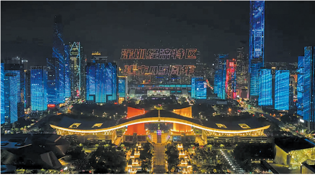
深圳无人机灯光秀

近期,深圳无人机产业释放出新信号,新势力正在全面涌进这一新兴赛道。智能清洁企业追觅宣布,将正式拓展无人机业务,并在深圳设立无人机项目公司。对此,追觅无人机业务负责人近期回复羊城晚报记者称:“深圳作为追觅核心基地,将持续获得资源倾斜,未来成为追觅‘空地一体’战略的支点。”无独有偶,总部位于深圳的全景相机企业影石也于一个月前推出全景无人机品牌“影翎”,随后宣布开启公测。 无论是“外来客”的跨地域布局,还是“本地户”的大胆跨界,都将深圳视为开启无人机新蓝图的主要阵地。深圳市低空经济产业协会相关负责人向记者分析,这一“跨界潮”的兴起,折射出深圳作为全国最具吸引力的无人机产业高地,正从原有的“专业选手时代”迈入“多元协同时代”。