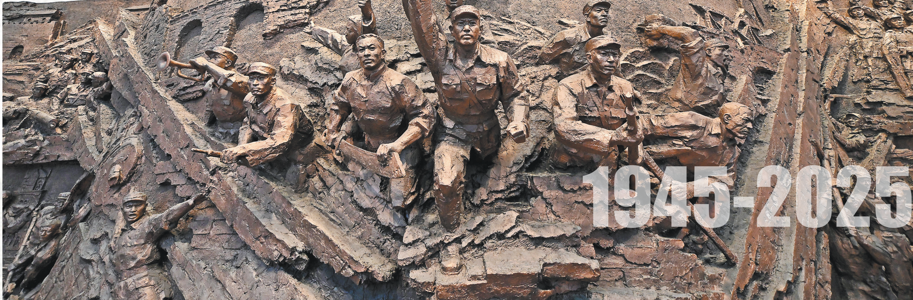
百团大战纪念馆雕塑。今年7月7日，习近平总书记在山西省阳泉市考察时来到这里参观，强调百团大战的历史壮举充分展现了我们党在全民族抗战中的中流砥柱作用，要求讲好抗战故事，把伟大抗战精神一代代传下去