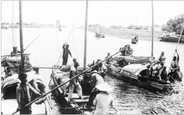
为新四军运送给养的洪泽湖运输队

新四军是中国共产党直接领导的抗日武装力量，由南方八省红军游击队改编而成。抗战期间，这支纪律严明、作风顽强的人民军队，活跃在长江以南的广大敌后地区，灵活运用游击战术，牵制大量日、伪军，是敌后抗战的中坚力量，也被誉为中国抗战场上的“铁军”。