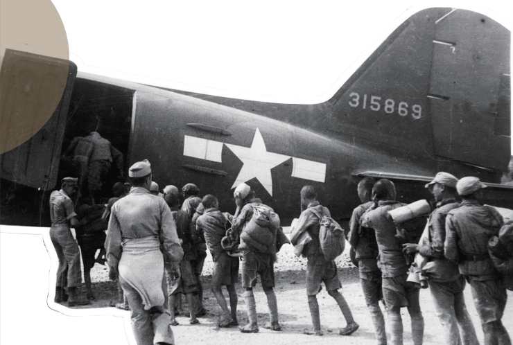
参加远征军的士兵在登机

1943年7月，全国抗日战争转入战略反攻阶段，中国共产党领导敌后战场（其后亦称解放区战场）广大军民向日、伪军连续发起局部反攻作战，大量消灭敌人，收复了大片国土。1943年10月和1944年5月，中国驻印军和远征军在缅甸、滇西也开始反攻作战，收复了滇西、缅北广大地区。1945年8月9日开始，中国解放区战场对日、伪军展开大规模全面反攻，取得了辉煌战果。1945年8月15日，日本宣布无条件投降。