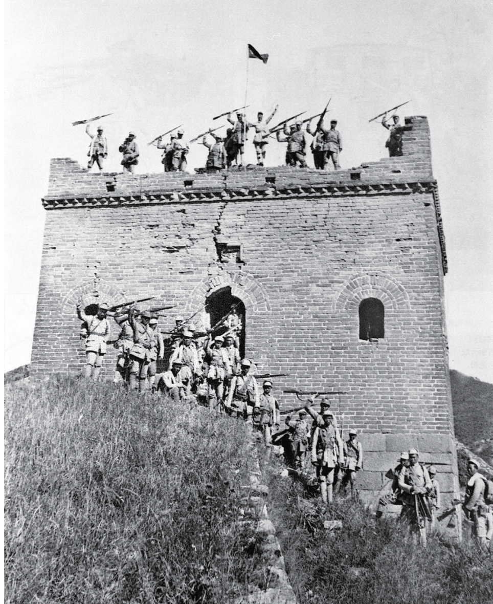
百团大战中，八路军攻克涞源县日军据点东团堡