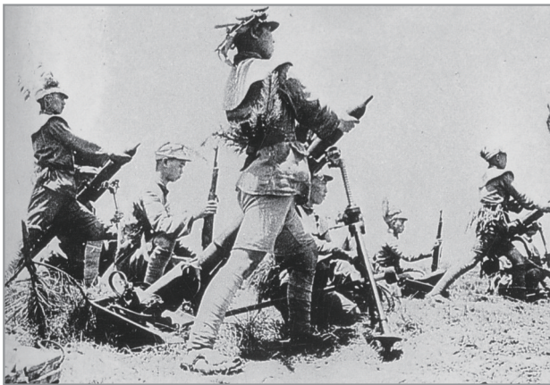
武汉保卫战中，我军向敌人发射迫击炮