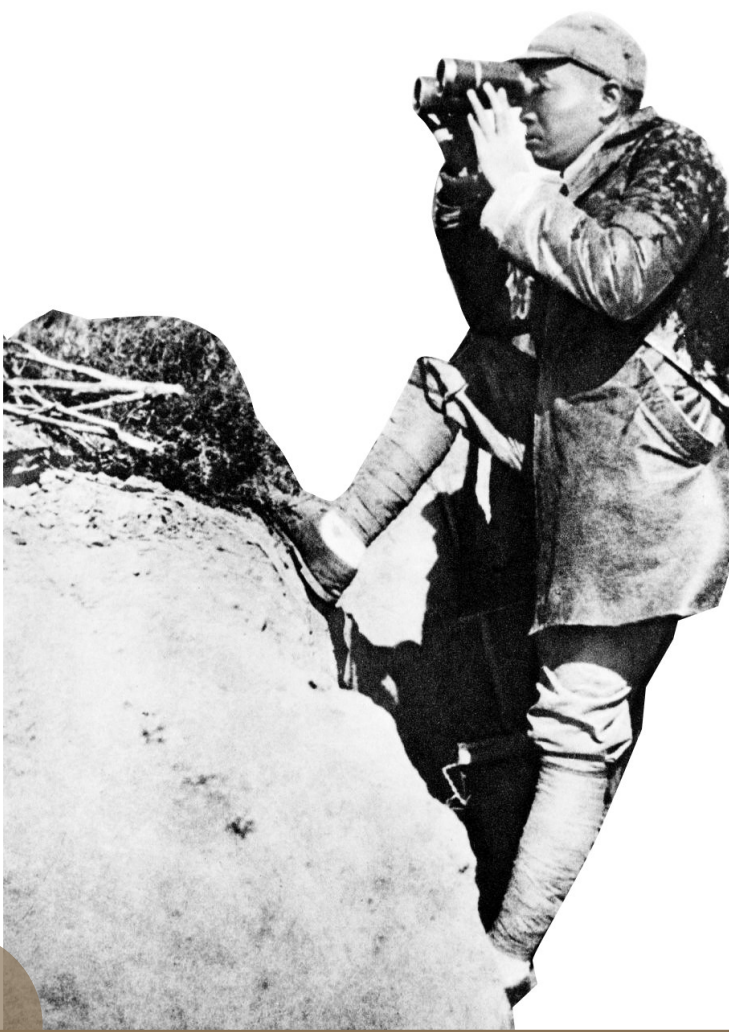
彭德怀在“百团大战”时指挥作战

黄土岭战斗，是1939年11月八路军在华北敌后抗日根据地涞源、易县交界山区取得的一次反“扫荡”的辉煌胜利。此次战斗击毙了日本素有“名将之花”称誉的阿部规中将。击毙这样的日军高级指挥官，在华北战场还是第一次，在中国人民的抗战史上也是第一次。这一战役，一扫侵华日军之骄横，震惊了日本朝野，沉重打击了侵华日军的嚣张气焰，极大地鼓舞了全国军民的抗战士气。