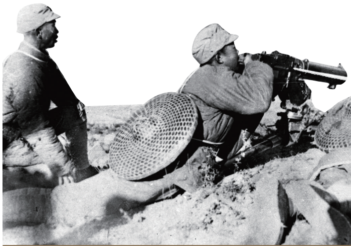
平型关战斗中，八路军第115师某部的机枪阵地