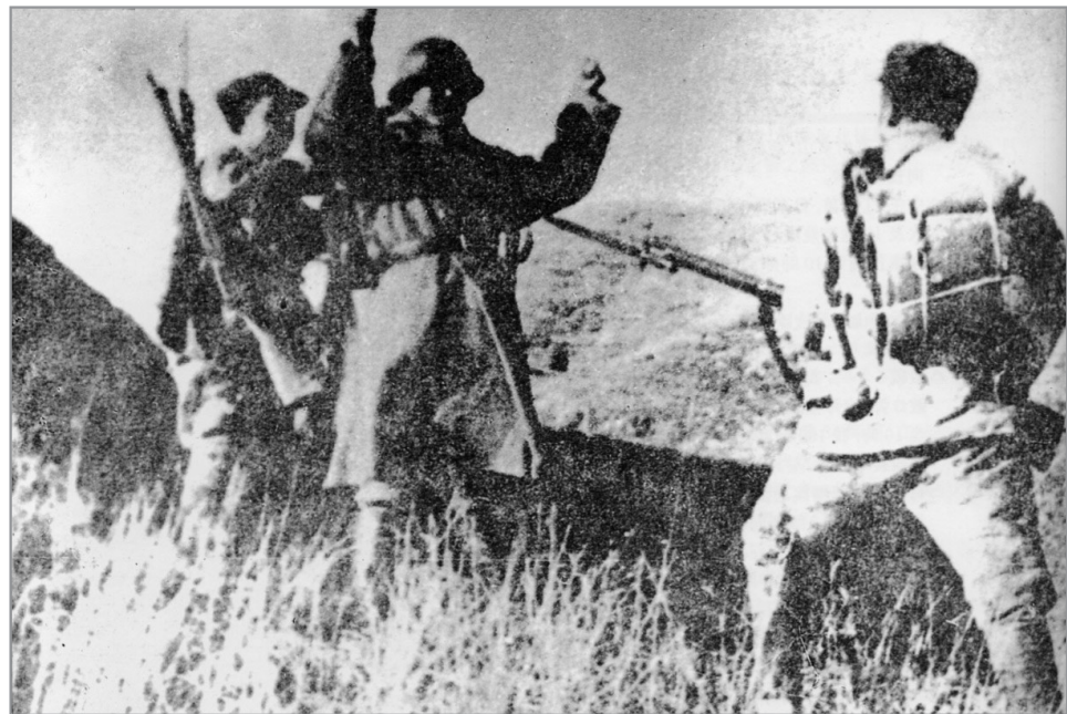
我军战士在第三次长沙会战结束时捕捉战敌