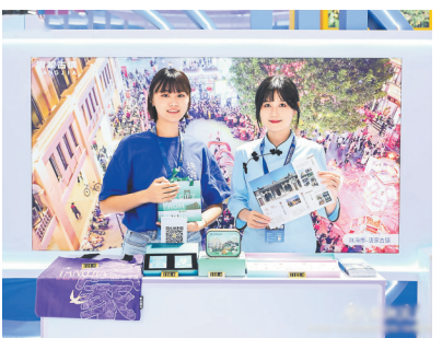
唐家古镇原创文创,为游客留下美好的古镇记忆

这场传统与现代的精彩对话,不仅让游客用脚步投票,更赢得专业的认可。近日,2025广东国际旅游产业博览会(以下简称“广东旅博会”)上,唐家古镇连续荣获“广东省2025年度文旅促消费优秀案例”和“2025年广东省文旅消费新业态热门场景”“2025年广东省文旅消费新业态十大网络票选热门场景”三项荣誉。在国家文旅产业持续升级、积极推动“百千万工程”文旅融合发展战略的背景下,这个曾经“明珠蒙尘”的百年古镇,如今正以全新的面貌,向世人展示着文旅融合的“珠海智慧”。