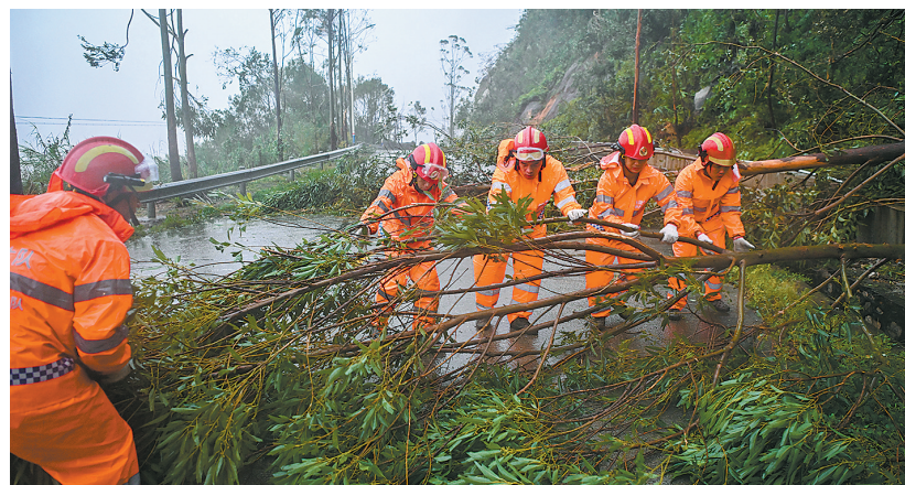
24日，江门台山市陡镇专职消防队在228国道清理倒树

面对影响范围广、破坏力大的“桦加沙”，广东各地提前行动，把保障人员安全放在第一位，全力组织危险区域群众转移安置。广东省应急管理厅数据显示，截至24日18时，全省共转移超222万人。