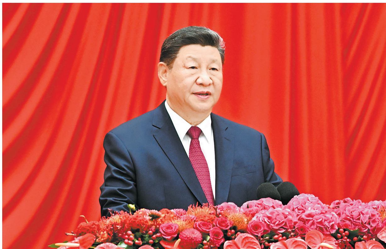
9月30日晚，庆祝中华人民共和国成立76周年招待会在北京人民大会堂举行。中共中央总书记、国家主席、中央军委主席习近平出席招待会并发表重要讲话