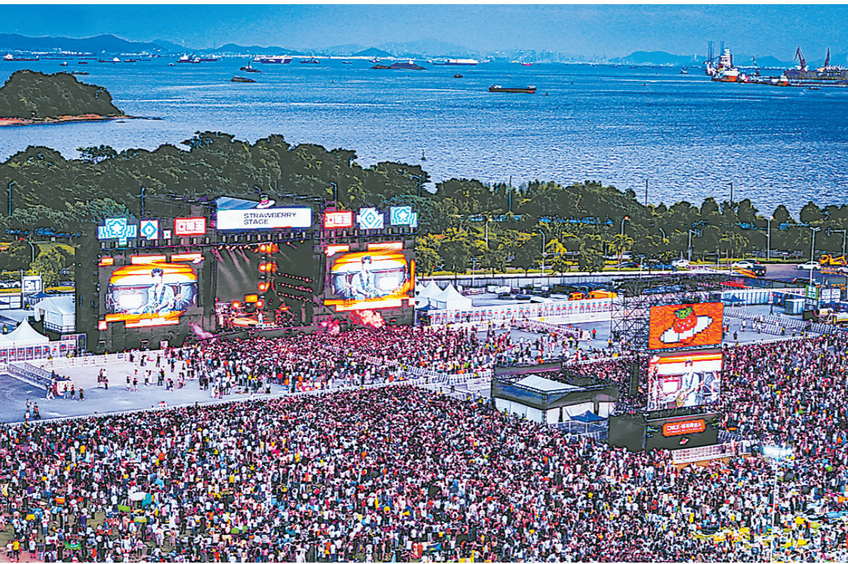
草莓音乐节现场人山人海