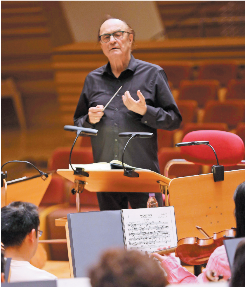
指挥大师迪图瓦

迪图瓦说：“在和上海交响乐团进行了一次次高难度作品的合作之后，我觉得是时候把《沃采克》提上日程了。这是我第39次来中国，和1982年我第一次来的时候相比，40多年来中国的发展令人震惊，古典音乐也是如此，