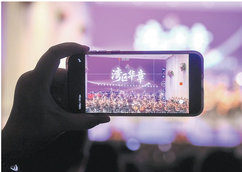
《湾区华章》主题交响音乐会现场