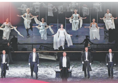
《叶普盖尼·奥涅金》剧照

粤港澳三地还依托各自产业优势,通过艺术节形成了“国际资源—区域转化—全球输出”的产业链。2025年,广东省借助大湾区艺术节平台,吸引俄罗斯瓦赫坦戈夫剧院、希腊国家歌剧院等国际团体到访演出;广东粤剧院的精品剧目《最是女儿香》《红头巾》也通过大湾区艺术节拓展海外巡演渠道,在国际市场走得更深更远。粤剧名家曾小敏认为,大湾区艺术节充分发挥了粤港澳大湾区的区位优势与文化优势,真正成为汇聚全国精品、促进戏曲交流的盛事。