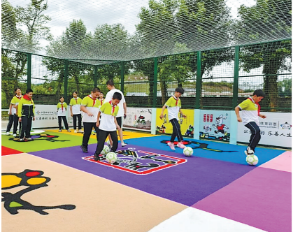
孩子们告别了“没处练球”烦恼

十年，足以让一束微光，照亮一条长长的路。这束由深圳体彩“微光行动”汇聚的光，蜿蜒穿过肇庆的山谷，漫过惠州的田野，倾注于梅州的绿茵；它的每一程都通向新起点，点亮新未来。2025年秋天，两座崭新的足球场，成为这段旅程的最新注脚。