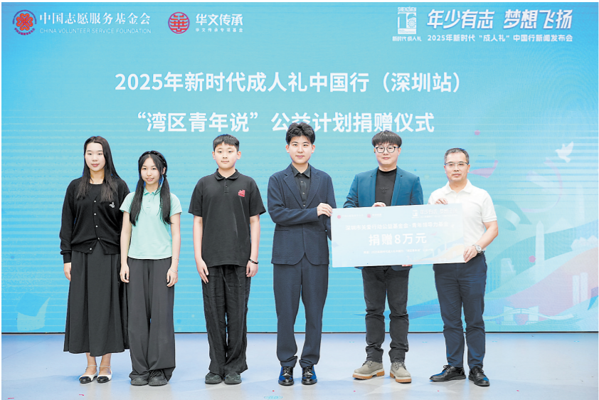
青年学子代表们上台捐赠

羊城晚报讯 记者张小悦报道:11月12日,由中国志愿服务基金会、中共广东省委社会工作部指导,羊城晚报报业集团等单位联合主办的2025年新时代“成人礼”中国行新闻发布会在深圳举办。2025年新时代“成人礼”中国行活动将于12月21日分别在广州与深圳举行,其中广州站活动由羊城晚报报业集团主办。