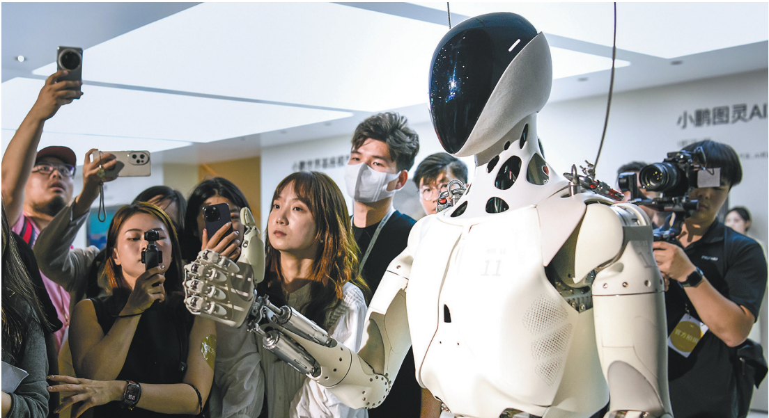
小鹏机器人

在台前,广东人形机器人可以是能跑会演的气氛担当;当转向幕后,它们则摇身一变,化身能干好活的“新工人”“好保姆”,精准适配工业、家庭等多元场景。这种转变说明,广东人形机器人已不满足单一的技术展示,而是全面拥抱以应用和交付为核心的产业化“下半场”。