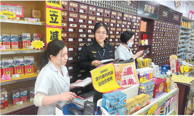
江门市市场监管局检查赛场周边药店

第十五届全国运动会(以下简称“十五运会”)已经开幕,江门赛区承办赛事激战正酣。赛场上运动健儿奋力拼搏,赛场下市场监管力量保驾护航。江门市市场监管局立足监管职责,强化食品、药品安全全过程监管,营造公平、诚信、和谐的市场消费环境,为赛事顺利举办提供坚实保障。