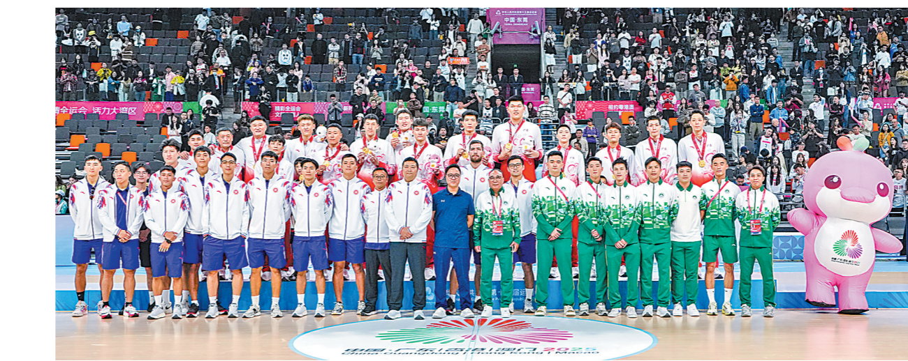
11月12日，篮球男子成年组决赛夺冠后，广东队（后）和香港队（前左）、澳门队合影

当吉祥物“喜洋洋”“乐融融”火出圈，会徽“同心礼花”镌刻在大湾区各个角落，澎湃的会歌响彻大湾区各个角落，粤港澳三地同心同德的情缘也传递至人们心中。 严兴认为，大型体育赛事的文化产物在塑造国家认同与区域认同方面具有独特功能，十五运会会歌不仅是艺术呈现，更为凝聚社会共识、增强国家凝聚力提供了有效实践范式。“会歌是以文化符号凝聚人心、以情感共振促进融合的实践工具，为大湾区从物理连接走向心灵相通提供精神支撑。” 羊城晚报记者 张瑞宁 李焕坤