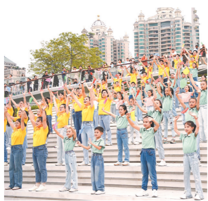
11月2日，230名老少市民在广州塔下齐唱会歌，为迎接十五运造势

歌手古巨基（中国香港）接受采访时说：“粤语版会歌一响起，就会让人想起这一届在粤港澳三地举办的运动盛会。”广东省音乐家协会主席金旭