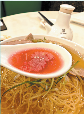
吃云吞面,浙醋别倒多

近日,广州正式为叉烧、馄饨等经典美食发布了“标准英文名”:叉烧就叫“Char Siu”,馄饨就是“Wonton”。十五运会刚刚落幕,残特奥会即将开赛。相信不少朋友在各地观赛之余,都会来碗风靡大湾区过百年、富含广府美食基因的地方特色小吃——云吞面。