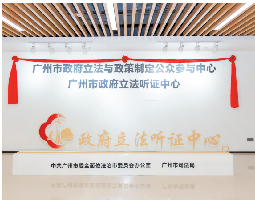
2025年9月,广州建成全国首个线下实体化运作的政府立法公众参与平台

在推进社会治理体系和治理能力现代化的时代浪潮中,广州始终坚持以人民为中心的发展思想,锐意进取,守正创新,从全国首个政府立法公众参与线下实体平台的建设到市场主体登记确认制的首创推行,从“政务晓屋”的智慧化实践、警示教育基地的创新探索到直播电商合规体系的构建,广州以一系列标志性创新举措,回应群众期盼、破解治理难题,走出了一条具有广州特色、可复制推广的社会治理现代化之路。