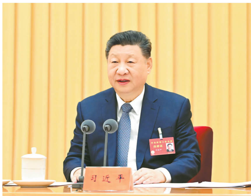
12月10日至11日，中央经济工作会议在北京举行。中共中央总书记、国家主席、中央军委主席习近平出席会议并发表重要讲话

会议指出，明年经济工作在政策取向上，要坚持稳中求进、提质增效，发挥存量政策和增量政策集成效应，加大逆周期和跨周期调节力度，提升宏观经济治理效能。要继续实施更加积极的财政政策。保持必要的财政赤字、债务总规模和支出总量，加强财政科学管理，优化财政支出结构，规范税收优惠、财政补贴政策。重视解决地方财政困难，兜牢基层“三保”底线。严肃财经纪律，坚持党政机关过紧日子。要继续实施适度宽松的货币政策。把促进经济稳定增长、物价合理回升作为货