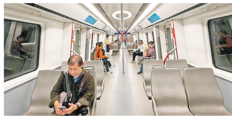
广州地铁二十二号线列车内