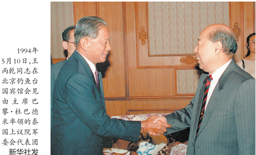
1994年5月10日,王丙乾同志在北京钓鱼台国宾馆会见由主席巴攀·杜巴德米率领的泰国上议院委员会代表团