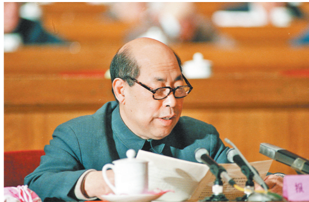
1987年3月26日,王丙乾同志在六届人大五次会议上作关于1986年国家预算执行情况和1987年国家预算草案的报告