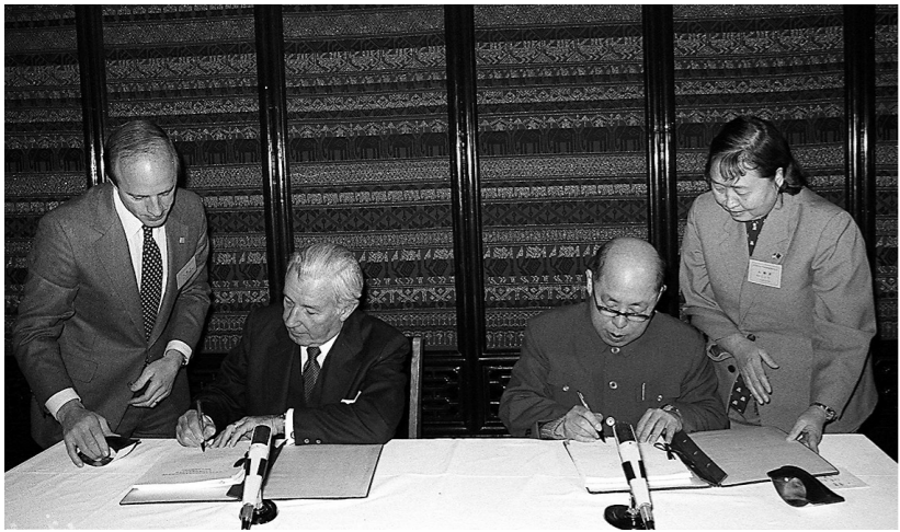
1984年3月21日,王丙乾同志和美国财政部长唐纳德·里甘分别代表两国政府草签协定