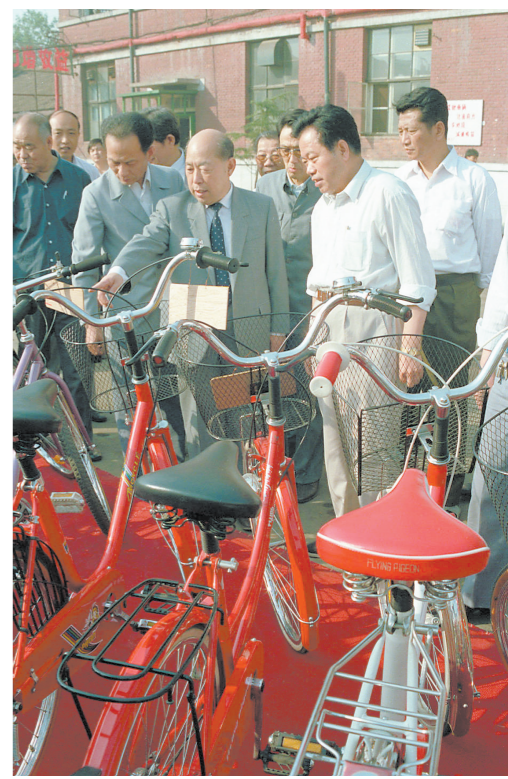
1990年6月3日,王丙乾同志在天津自行车厂考察 新华社发