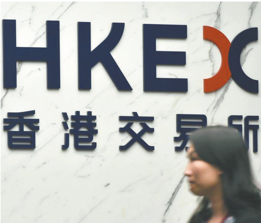
香港交易所