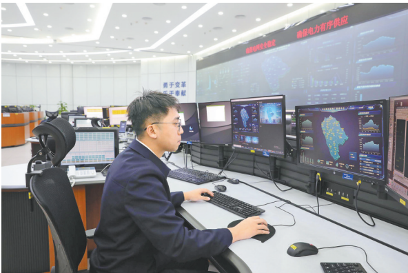
中山市虚拟电厂管理中心工作人员监测 分布式新能源、可调负荷情况

随着政策、资金、企业等多方要素的持续互动与融合,一个涵盖“机制设计-系统支撑-资源聚合-运营服务-生态配套”的虚拟电厂产业价值链正在广东加速形成。