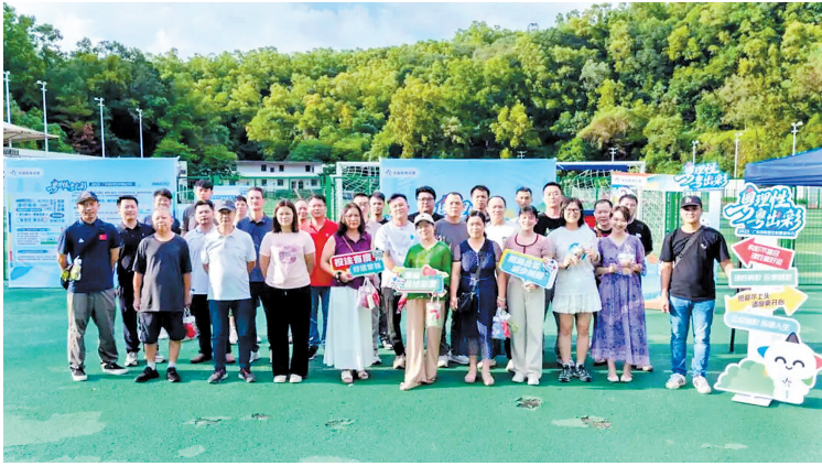
富有创意、贴近大众的活动