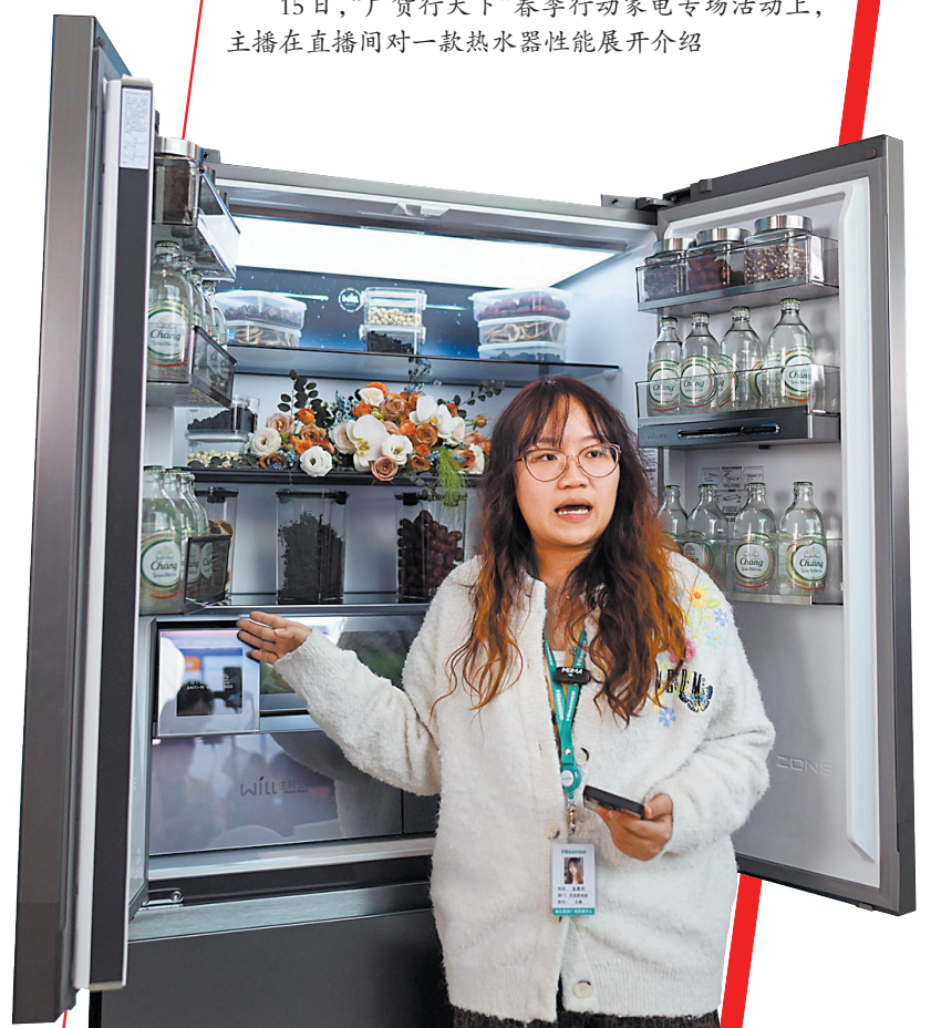
15日,“广货行天下”春季行动家电专场活动上,主播详细介绍冰箱保鲜技术