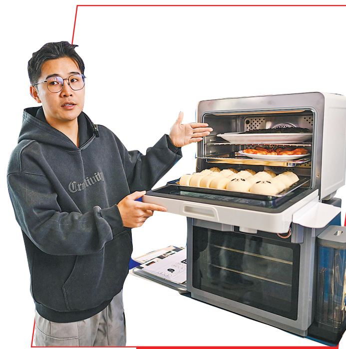
15日,“广货行天下”春季行动家电专场活动上,主播向消费者推荐蒸烤炸一体机