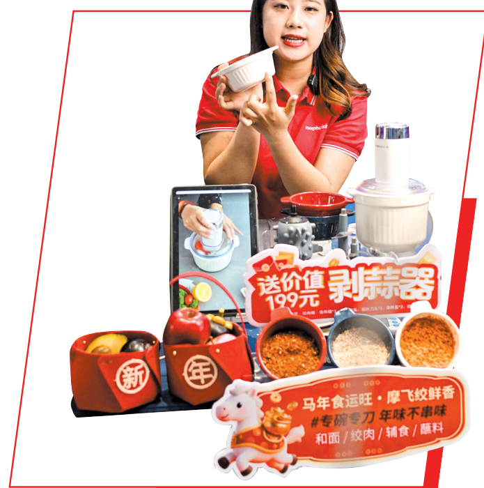
15日,“广货行天下”春季行动家电专场活动上,主播详细介绍产品性能