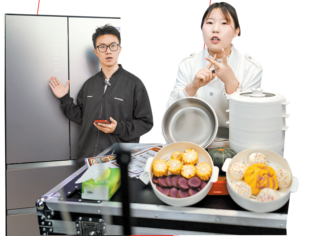
15日,“广货行天下”春季行动家电专场活动上,主播正在介绍冰箱(左)和小家电产品(右)