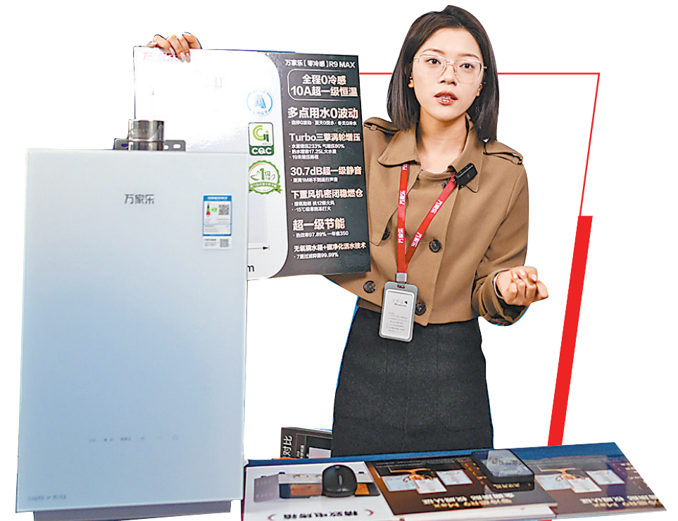
15日,“广货行天下”春季行动家电专场活动上,主播在直播间对一款热水器性能展开介绍

统筹/孙晶 文/羊城晚报记者 杭莹 沈珂 扶贝贝 张闻