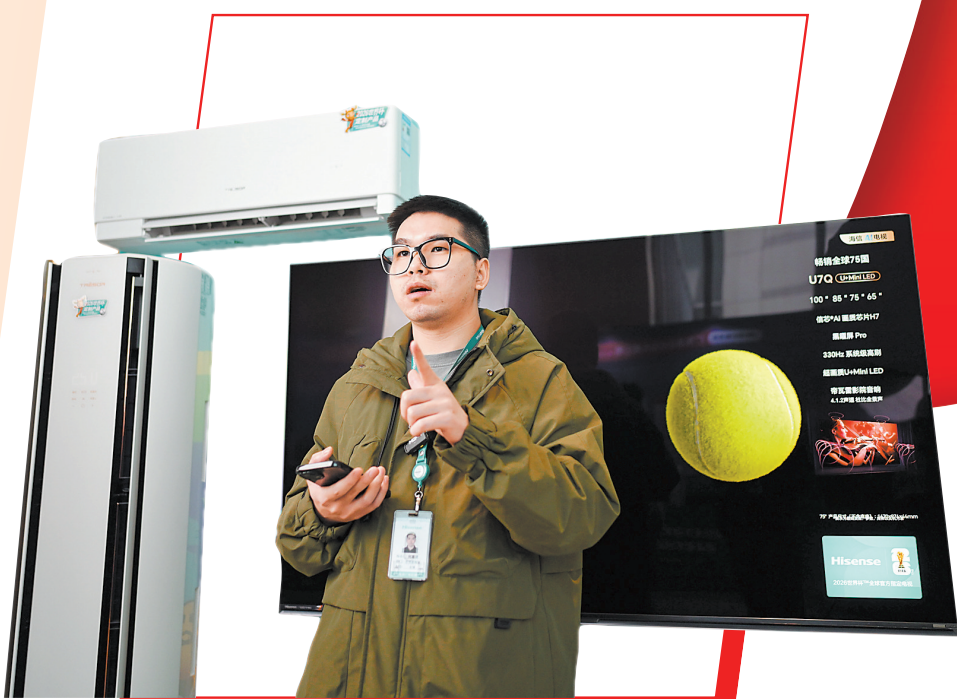
15日,“广货行天下”春季行动家电专场活动上,主播介绍企业展示的空调等家电产品