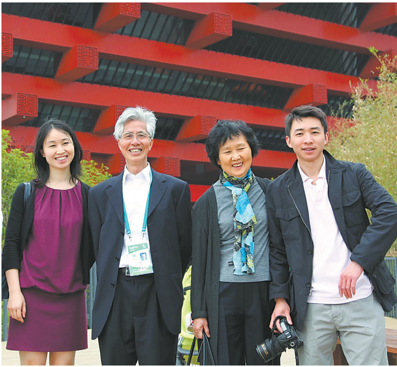
何镜堂与夫人、女儿、儿子一家人合影

2025年5月23日，何镜堂登上全国道德模范的领奖台——从岭南水乡少年到中国建筑界领军者，从相濡以沫的伴侣到言传身教的父亲，何镜堂的人生轨迹中，始终流淌着“真诚、坚韧、传承”的家风清泉，深刻诠释了优良家风如何滋养品格、支撑事业，并最终升华为感动中国的道德力量。