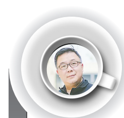
【夕花朝拾】杨早 中国社科院文学研究所研究员