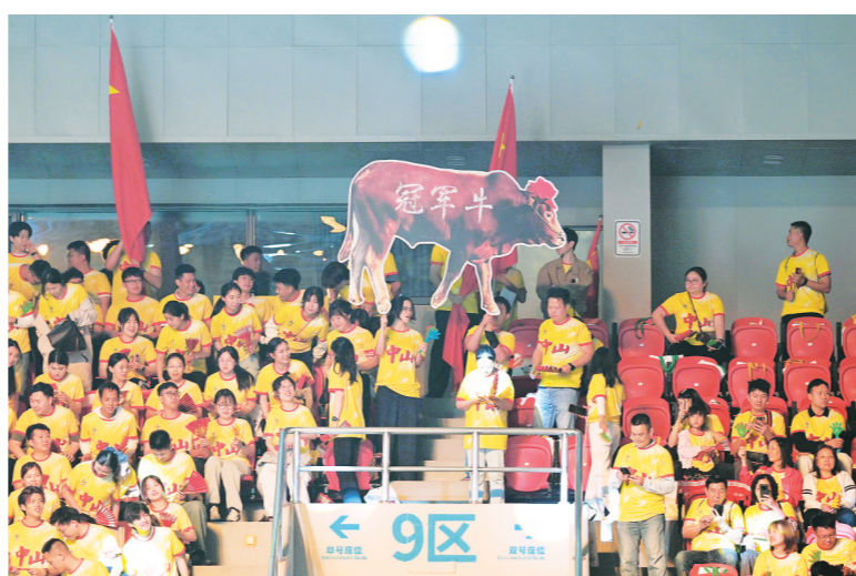
广州队与中山队的对决被称为“牛羊大战”