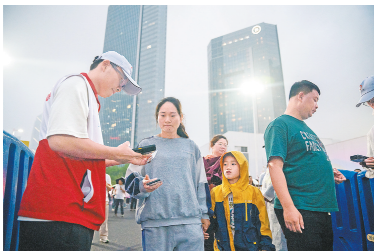
检票口处，家长带着小孩检票入场