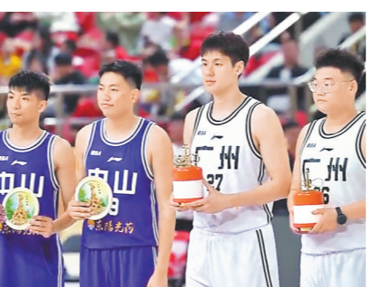
两队球员互送特产礼物