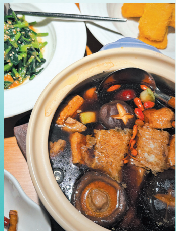
菌类是素食店的门面

几年前到杭州，路过一家素食店，被一碗黑松露炒饭勾住了魂。那一碗质朴的饭，米粒分明，切得细碎的黑松露混入其中，猛火催出香味。一勺入口，饭裹着油，油沾着饭，伴着菌香，口感丰富，味蕾在疯狂打架。由此记住了店名，庆春朴门。