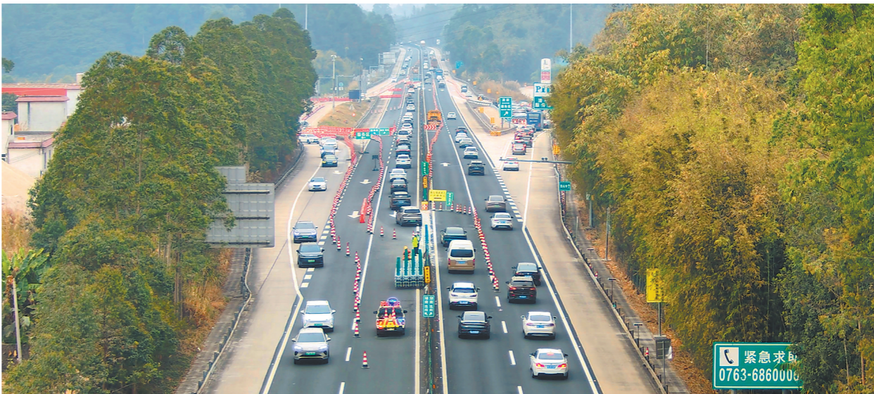
春运期间，许广高速上“交警带头逆行”开辟的“潮汐车道”

目前，河源正在推动“1+1+2+N”规划体系建设深化工作，全面摸排“生态家底”，核算环万绿湖核心片区生态价值（GEP）约1355.55亿元。推动金融机构创新“VEP+”（特定地域单元生态产品价值）信贷模式，成功实现万