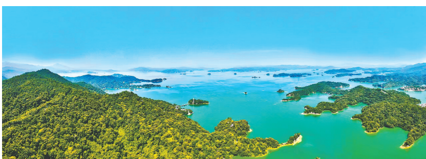
河源万绿湖

羊城晚报讯 记者吴奕镇、通讯员陈殷报道：3月31日，河源市环万绿湖“湖泊+”绿色发展区建设指挥部第二次全体会议召开。会议听取了环万绿湖“湖泊+”绿色发展区（以下简称“绿色发展区”）建设工作进展等情况。