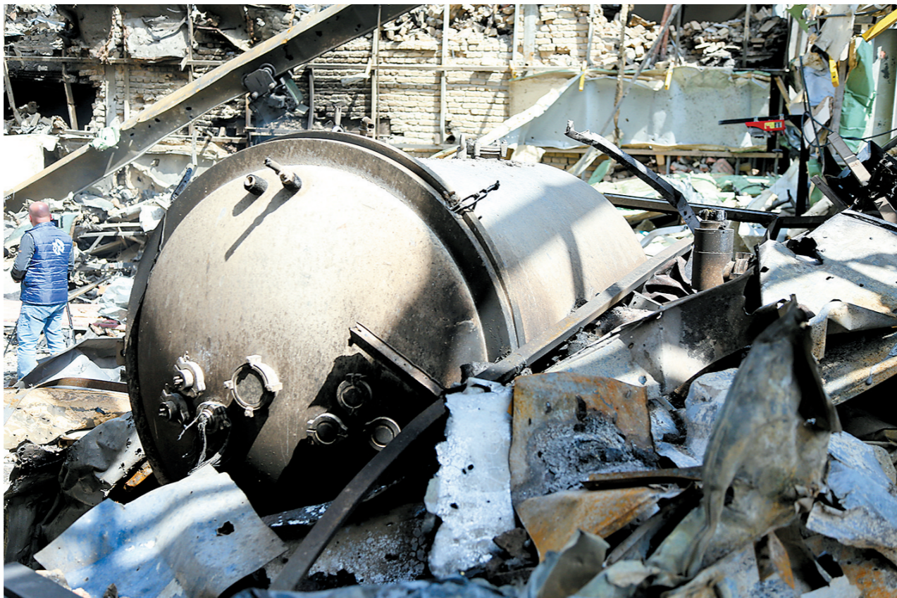
遭袭的伊朗德黑兰沙希德·贝赫什提大学一角

针对伊朗与美国是否存在新的结束战争方案等问题,巴加埃说,美方此前通过巴基斯坦等调解方转达包含15点内容的停火提议,当时伊方就指出,美方计划“极为过分且不合理”,伊朗