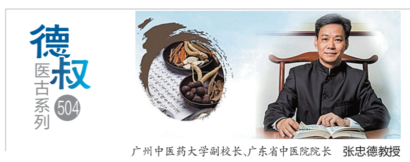
广州中医药大学副校长、广东省中医院院长 张忠德教授