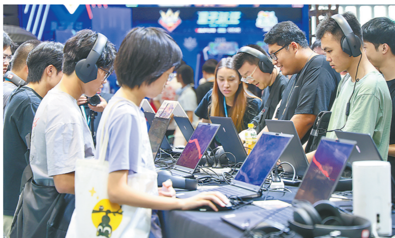
AGF亚洲游戏博览会期间,玩家在现场试玩游戏(资料图)

“出海”方面,搭建公共服务平台。上海提出建设“游戏出海服务平台”,涵盖本地化、法律合规、支付结算、数据分析等环节。过去这些服务只有大厂自己能搭建,小团队难以负担。若能做成真正开放的公共产品,对大量中小“出海”团队将是实实在在的利好。沐瞳科技扎根上海多年,《决胜巅峰》在东南亚成绩斐然,但上海需要的不仅是一个沐瞳,而是一批能够走出去的中坚力量。