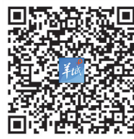
扫码看粤超全赛程