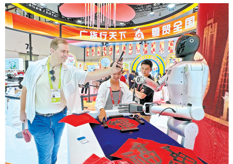
消博会广东馆内，机器人写福字，吸引外商打卡

来自广东省制造业协会的数据显示，本届消博会上，广东经贸代表团共达成合作项目17个，金额35.33亿元，涵盖智能科技、电子信息、健康食品、家居厨具等领域，为粤琼产业协同、贸易互通按下“快进键”。