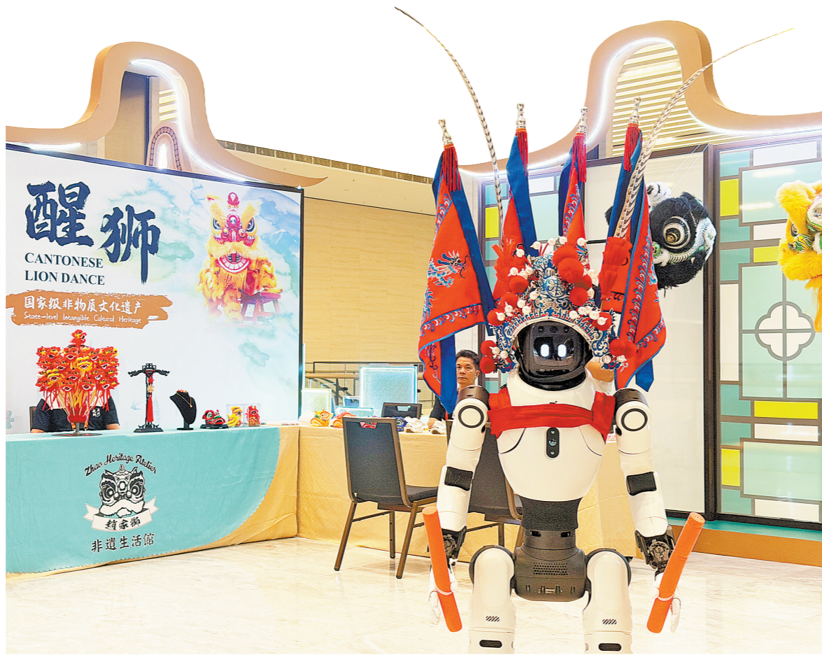
古今岭南韵，同场秀风采

本届广交会展览总面积达155万平方米，展位7.57万个，参展企业超3.2万家——三项核心指标均超过往届，约3900家企业首次亮相，共同在“十五五”新起点上，为全球客商烹制一场“先进制造”的饕餮盛宴。