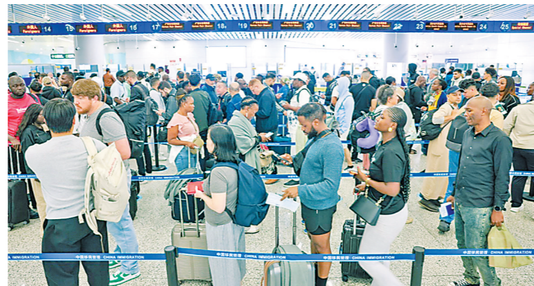
广州白云机场口岸迎来客商入境高峰

当前，白云机场口岸出入境客流呈现“三期叠加、梯次攀升”的特点，入境客流高峰集中在4月14日、15