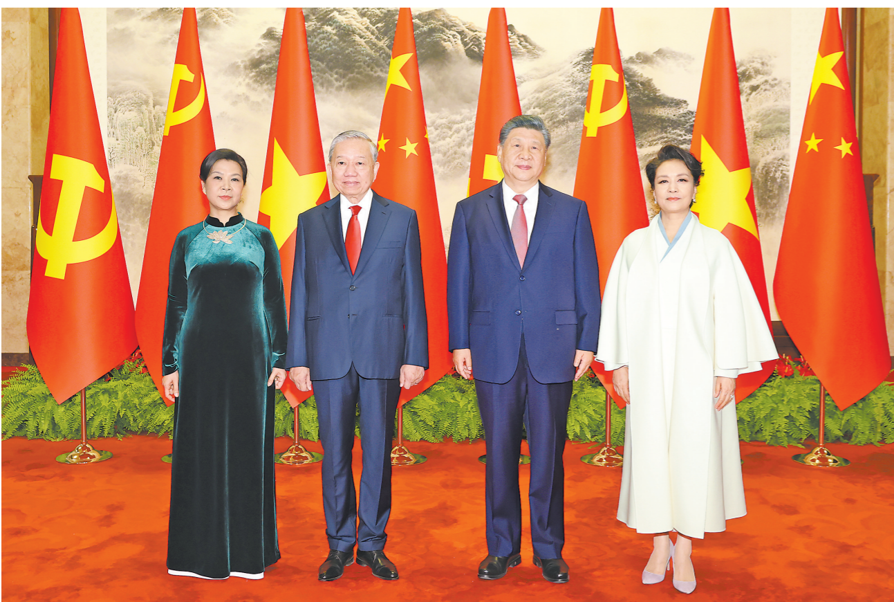
4月15日上午，中共中央总书记、国家主席习近平在北京人民大会堂同来华进行国事访问的越共中央总书记、国家主席苏林举行会谈。这是会谈前，习近平和夫人彭丽媛同苏林和夫人吴芳瑞合影

新华社电 4月15日上午，中共中央总书记、国家主席习近平在人民大会堂同来华进行国事访问的越共中央总书记、国家主席苏林举行会谈。