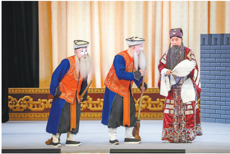
2026年4月11日深圳京剧院上演《失空斩》