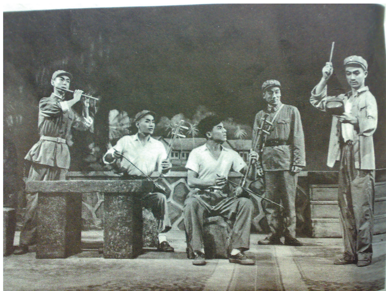
1965年广州京剧团新编现代戏《带兵的人》剧照