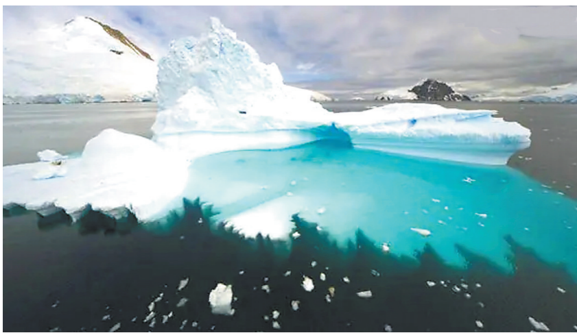
南极绿冰(资料图片)

近日,曾被吉尼斯世界纪录认定为“全球最大的冰山”的南极冰山A23a已完成末次崩解,主体部分仅剩35.2平方公里。因达不到国际惯用的面积20平方海里(约68.6平方公里)冰山编号标准,这座冰山已正式宣告“销号”。