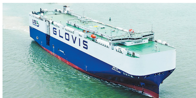
“格罗唯视 领航”轮具有绿色环保、节能高效、安全可靠等特点

海船舶研究院设计，总长230米，型宽40米，设计吃水10.5米，设计航速19节。该船设计14层车甲板，可灵活装载电动汽车、氢能源汽车及重型卡车等多车型，单船最大装车量达10800辆。按5米一台标准车计算，所装载的车辆首尾相连，超过50公里长，是名副其实的“海上巨无霸”。