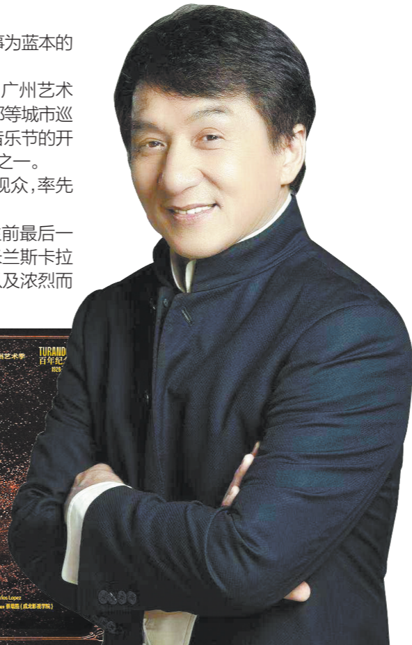
成龙跨界执导“功夫歌剧”