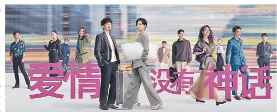
《爱情没有神话》海报

都市情感剧《爱情没有神话》4月28日正式开播,该剧在独特的摩登格调中,带领观众感受都市男女的情感百态与现实境遇。