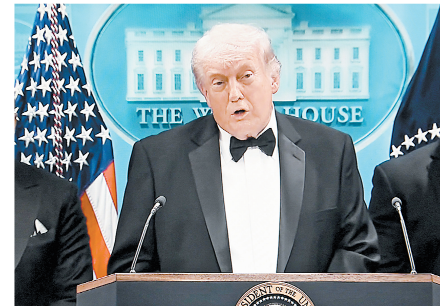
美国总统特朗普