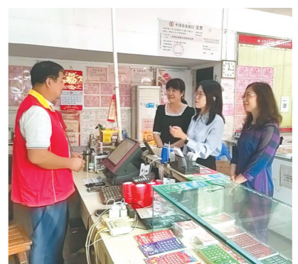
调研组在站点了解理性购彩宣传情况

性购彩宣传落实情况,对站点规范经营、用心服务彩民的做法给予肯定,鼓励代售者继续保持专业服务态度,坚守社会责任,积极践行福彩公益使命,继续为福彩公益事业贡献力量。随后,调研组与代售者开展深入交流,详细了解站点在日常经营中遇到的堵点、难点问题,认真收集代售者关于精准施策、优化管理服务等方面的意见建议。调研组强调,各福彩销售站点要严守合规销售底线,积极倡导“理性购彩,量力而行”的购彩理念,常态化开展理性购彩宣传,共同维护健康有序的福彩市场环境,持续推动福彩公益事业高质量发展。