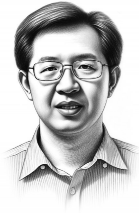
关锋：华南师范大学马克思主义学院院长、教授