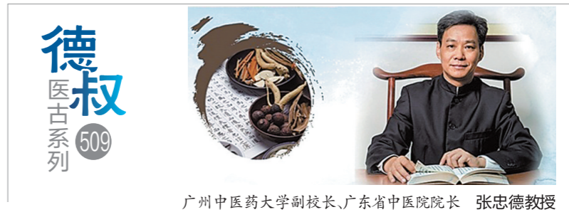
广州中医药大学副校长、广东省中医院院长 张忠德教授