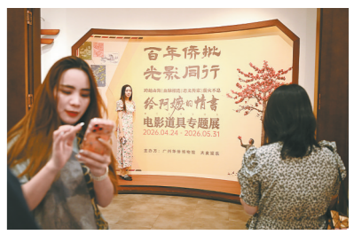
专题展吸引不少市民参观

拍完戏回到校园，思潼变得更加从容笃定了。“很多细碎的瞬间，我都能感觉到南枝留在我身上的影子。以前遇到事情我可能会慌，但现在我会像她一样，冷静地去面对、去解决。”她在自媒体上写道：“成为南枝的时光，就像一场梦。很幸运可以替她活一次，也很庆幸，她把勇气和力量留给了我……”