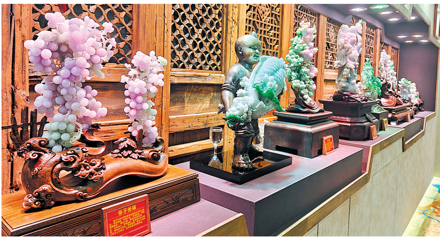
中国四会玉器博览城「颜如玉」中展示精品摆件

而广州市杂技艺术剧院原创现实题材杂技剧《天鹅》已于4月24日-5月1日赴俄罗斯巡演，先后登陆有着“世界级艺术殿堂”之称的莫斯科大剧院、素有“俄罗斯艺术航母”盛名的马林斯基剧院。此次巡演也大受当地观众欢迎，展示了广东文艺创作的实力和魅力。