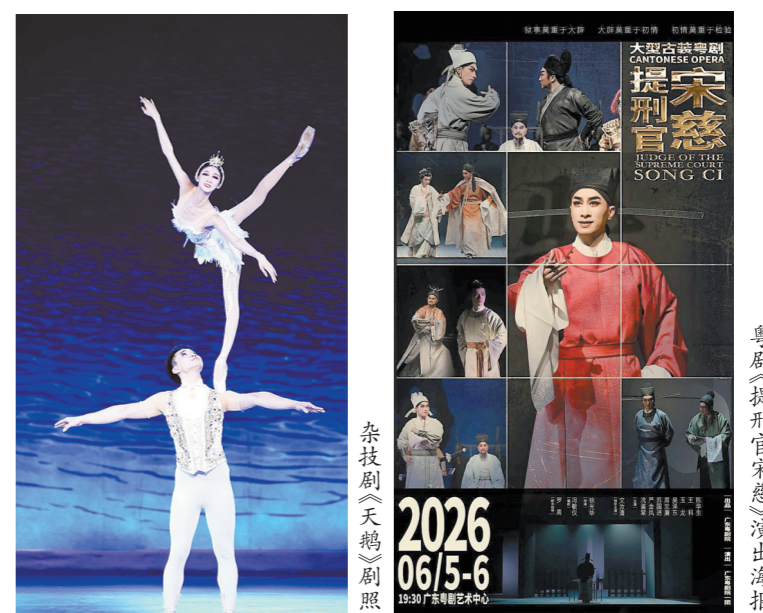
粤剧《提刑官宋慈》演出海报