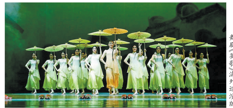
舞剧《英歌》海外巡演版

线路推荐：汇玉堂国际玉文化博物馆→庄家7文化创意园→天光墟→中国玉器博览城→LIVE直播基地→四会古法造纸研学基地。