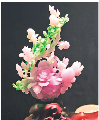
中国四会玉器博览城内展示精品摆件(局部)

四会这座小城，本身不产玉石，却上演着“点石成金”的产业传奇。这枚浸润匠心与创意的“广东名片”，正以玉为媒，串联起非遗传承、产业集群与全新的文旅体验，让千年玉韵在新时代绽放“出圈”活力。