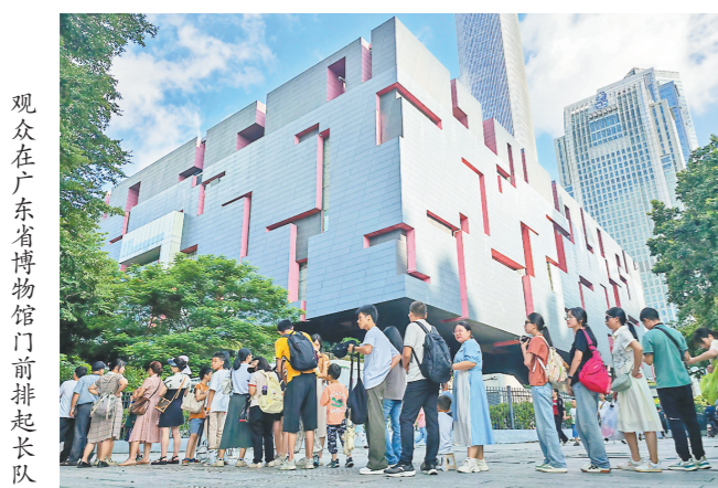
观众在广东省博物馆门前排起长队

如今，大湾区文博机构的联动合作已然走向常态化。从搭建平台到联合策展，大湾区以文博为桥梁，打破地域边界、融通文化血脉，让世界透过大湾区文博窗口读懂岭南、读懂中国。