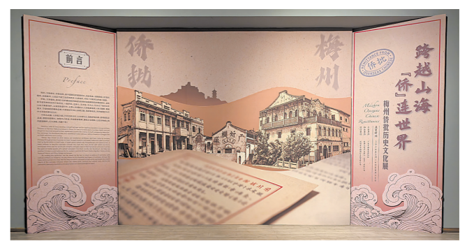
中国国家博物馆特别策划《跨越山海“侨”连世界——梅州侨批历史文化展》