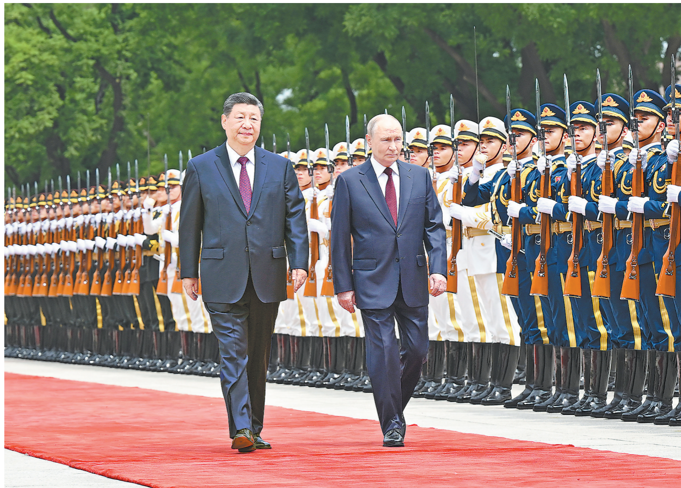
5月20日上午，国家主席习近平在北京人民大会堂同来华进行国事访问的俄罗斯总统普京举行会谈。会谈前，习近平在人民大会堂东门外广场为普京举行欢迎仪式

新华社电 5月20日上午，国家主席习近平在北京人民大会堂同来华进行国事访问的俄罗斯总统普京举行会谈。两国元首一致同意《中俄睦邻友好合作条约》继续延期。