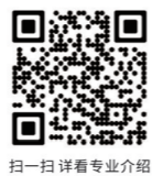
扫一扫详情专业介绍

学费:艺术类5600元/学年;工程类3800元/学年;文科类3300元/学年 住宿费:天河校区:650元/学年;花都校区:750元/学年(所有宿舍均配有空调、独立卫生间、热水器) 除服装表演专业外,其余专业农业户籍及县镇非农业户籍(部分)执行国家免学费政策 除电子商务、跨境电子商务和服装表演专业外,其余专业不招色盲、色弱