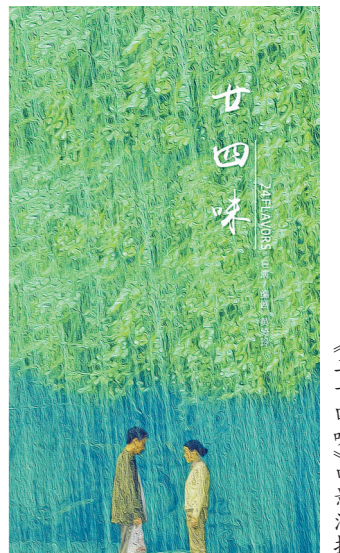
《二十四味》电影海报