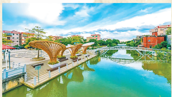
佛山顺德黄村鲤鱼沙公园

线“广东数字村史馆”。未来，广东将持续推动村史活化利用，支持有条件的乡村依托古祠堂、老建筑、新时代文明实践站等场地打造村史馆。与此同时，各地村史资源还将融入全民终身学习体系，成为最生动的“乡土教材”，让年轻一代也能铭记乡土根脉、传承岭南文脉。