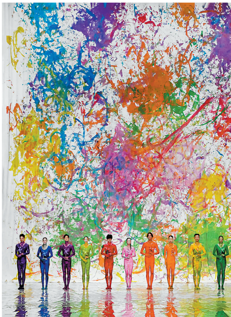
现代舞《心境》在广州大剧院举行世界首演

羊城晚报讯 6月5日，由国际著名艺术家沈伟担任总导演，沈伟舞蹈艺术团与广东现代舞团联合打造的整体艺术——现代舞《心境》在广州大剧院举行世界首演，观众反响热烈。6日晚，《心境》进行本轮首演的第二场演出。