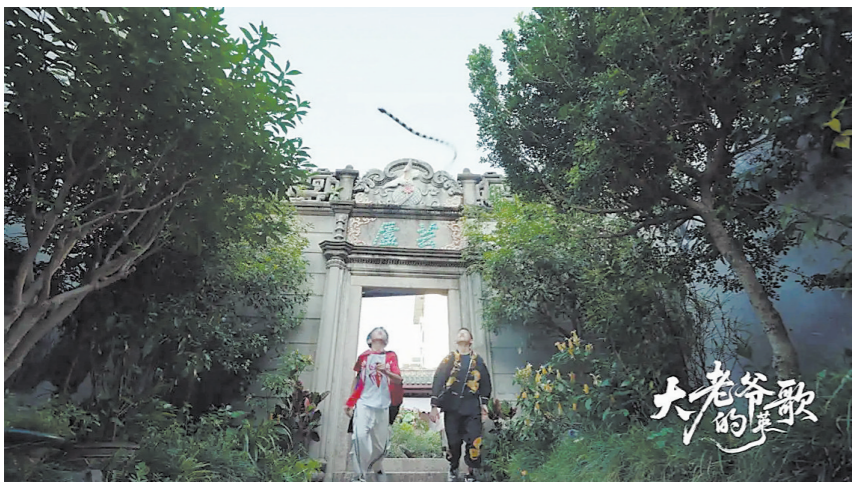
单元故事《大老爷的歌》剧照

正在全网热播的奇幻微短剧《潮州奇谭》，通过《大老爷的歌》《时间都说过》《走出阿嬷的花园》《生意大赚》《海纳百川》等五个单元故事，以潮州风土为底色，以青春故事为载体，将深厚绵长的侨文化贯穿始终。该剧深度挖掘潮汕侨乡的历史记忆、人文精神与情感根脉，通过侨批、海外潮人寻根、跨国亲情、科技复现侨史等鲜明元素，生动地展现了海内外中华儿女同根同源、心系家国的精神纽带，用影像书写了新时代侨文化传承的崭新篇章。