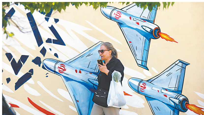
6月8日，一名女子在伊朗首都德黑兰街头行走

专家认为，美伊均已做好随时反击对方的准备。如果类似的突发事件再次发生，美国将再次袭击伊朗，伊朗也会坚决还击。若双方长期无法达成协议，不排除美国为实现“体面退出”而升级冲突、重开战事。此外，以色列在黎巴嫩的军事行动也是美伊谈判的一大“搅局因素”，恐进一步加大美伊达成协议难度。