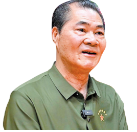
洪庆先 羊城晚报记者 王磊 摄