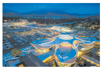
茂名柏桥服务区搭建起非遗消费新场景

6月13日是“文化和自然遗产日”。广东省主会场系列活动将于6月12日至14日在广东茂名盛大启幕。