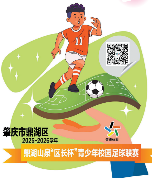
肇庆市鼎湖区 2025-2026学年 鼎湖山泉“区长杯”青少年校园足球联赛

近日，广东省肇庆市鼎湖区2025-2026学年鼎湖山泉“区长杯”青少年校园足球联赛闭幕式在肇庆新区体育中心副场举行。赛事共吸引全区中小学45支队伍、近千名足球健儿参赛，并得到了中国体育彩票的大力支持。